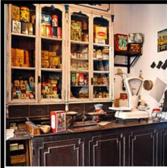
Tienda de Comestibles